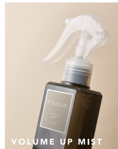
VOLUME UP MIST