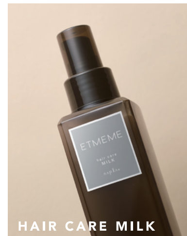
HAIR CARE MILK