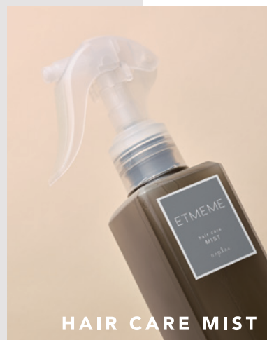
HAIR CARE MIST