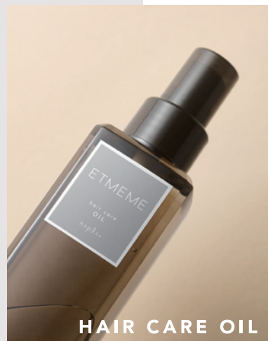
HAIR CARE OIL