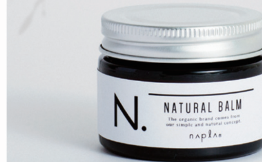
N. ナチュラルバーム 45g ¥2,200(税込) / 18g ¥1,320(税込)