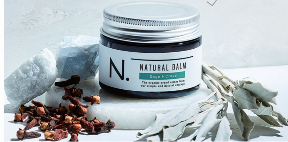
N. ナチュラルバーム SC 45g ¥2,200(税込) / 18g ¥1,320(税込)